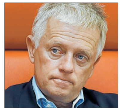
Fritz Kuhn, Bundestags-Fraktionsvorsitzender der Grünen, kommt nach Hall.